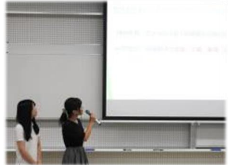
学生の成果発表の様子

この結果、学生間の発表内容への共感や新たな課題発見をすることが出来た。ある意味学生同士の評価ともなり得た。これらのプロセスを体験することで、新たな問題意識を芽生えさせた学生が見受けられた。