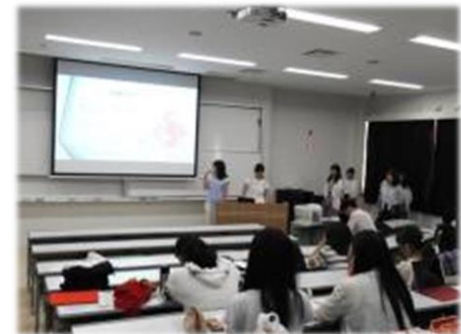
学生の成果発表の様子